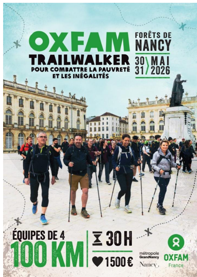
Affiche Trailwalker Oxfam Nancy 2026