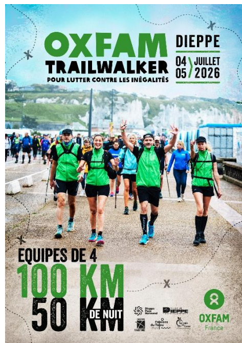
Trailwalker Oxfam Dieppe 2026 - Flyer personnalisable pour les équipes